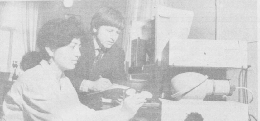
В лаборатории испытания хлопков и разработки стандартных методов ЦНИИХпрма занимаются проблемами по созданию инструментальных методов оценки качества хлопка-сырца и его продукции.