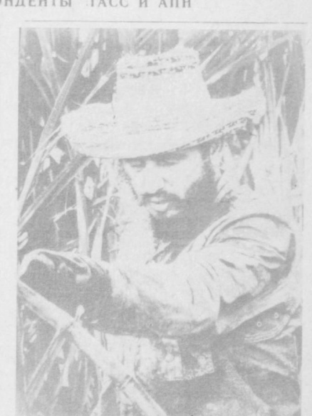
«Страна и люди» — так можно условно назвать фотокорреспондента о Республике Куба, открывающуюся недавно в Москве. Она знакомит с буднями и праздниками народа острова Свободы, с его замечательными труженниками — рабочими, крестьянами, деятелями культуры и искусства, отражает крепкие кубинско-советские контакты. Ее автор — крупный кубинский фотомастер Освальдо Салас.

★ ОТАВА. Ванкувер — крупнейший промышленный и портовый город на западном побережье Канады — объявлен зоной, свободной от ядерного оружия. В принятой городской советом резолюции указывается, что район Ванкувера объявляется зоной, свободной от ядерного оружия, и в его пределах запрещается производство, складирование, перевозка или размещение такого вида оружия или его компонентов.