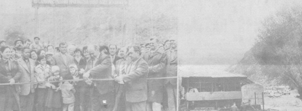
Продовольственная программа — дело всенародное

угрозой исторических памятников. ЭКЗЕКУЦИЯ В ШКОЛАХ. Телесные наказания продолжают широко применяться в американских школах. Об этом свидетельствуют результаты исследования, проведенного в США в сотрудничестве с американскими учеными. В отбываемых школах 18 штатов США, «испытывая» своих учеников, забывают их палками — линейками, книгами, таскают за волосы и т. п. Поводом для побоев может стать «неуважение к преподавателю», «неправильное поведение в классе», «разговор с соседом». Наиболее часто телесным наказаниям подвергаются школьники с небелым цветом кожи.