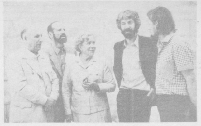
И не случайно в Ташкенте стелались не только режиссеры, актеры, художники-мультипликаторы, но и сценаристы, кинозвезды, другие специалисты в области кинематографа. Известные детские писатели. По-на ребяташки сидят в кинотеатрах, им есть о чем поговорить, что обсудить.

мов, проходящей в нашем городе. Но Неделя детских фильмов — это отнюдь не одни просмотры картин и встречи юных зрителей с их создателями и участниками. Одним из главных аспектов этого представительного форума создателей детского кино является их взаимный обмен творческим опытом, анализ новых филь-