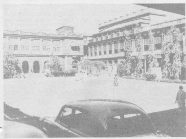
Дом-музей Рабиндраната Тагора в Калькутте. Здесь с любовью хранят память о великом индийском просветителе.