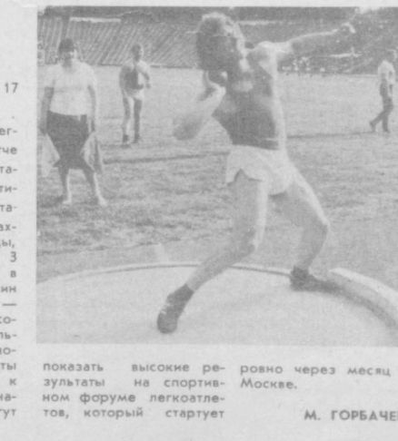
равно через месяц в Москве.

показать высокие результаты на спортивном форуме легкоатлетов, который стартует