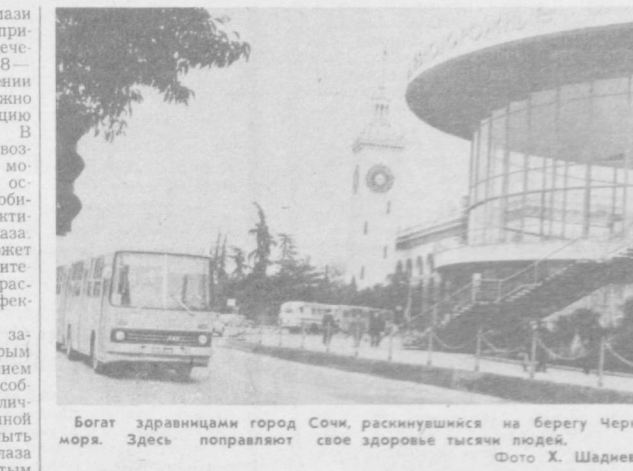
Богат здравницами город Сочи, раскинувшийся на берегу Черного моря. Здесь поправляют свое здоровье тысячи людей.

и закладывания мази в глаза, а также применение общего лечения продолжительностью 10 дней. По истечении этого срока можно считать инфекцию ликвидированной. В противном случае возбудитель болезни может ослабнуть, но остаться постоянным обитателем конъюнктивной полости глаза. Тогда человек может стать бактерионосителем и постоянным распространителем инфекции.