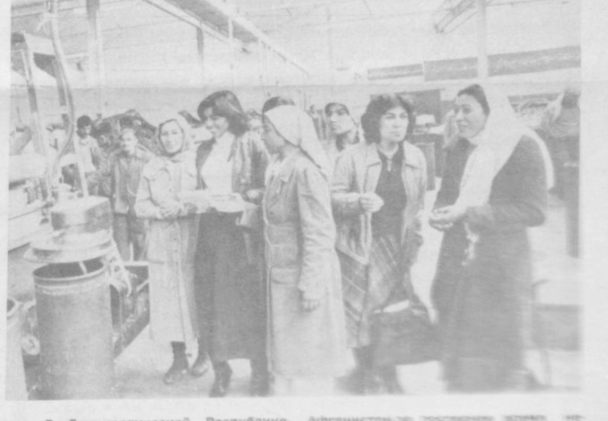
В Демократической Республике Афганистан женщины активно участвуют в общественной жизни. Сейчас афганские женщины участвуют на заводах, фабриках, сельскохозяйственных фермах. Это повышает их статус в обществе и способствует развитию экономики.