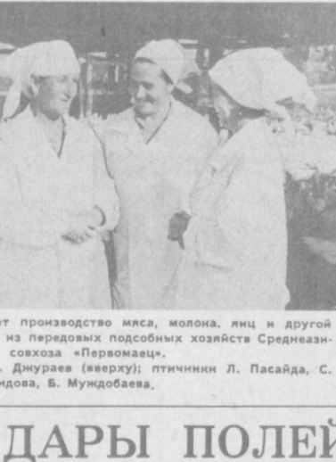
На года в год наращивает производство мяса, молока, яиц и другой продукции колхозы одного из передовых подсобных хозяйств Среднеазиатской железной дороги — совхоза «Первомайск».

Осуществляются в свете Продовольственной программы меры по более рациональному использованию ресурсов. Освоено выпуск ряда наименований новых мелкоштучных изделий. До 6 тонн в сутки сейчас выпускается 50-граммовых куцеских булочек. Эти изделия пользуются большим спросом у населения, особенно в школах всеобщего дет-