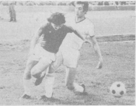
НА СНИМКАХ: в игре «Пахтакор».