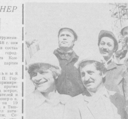
Высоких достижений в соревновании в честь 2000-летия Ташкента добиваются строители треста «Высотстрой-11».