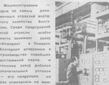
МАШИНОСТРОЕНИЕ — одна из самых динамичных отраслей народного хозяйства Болгарии. Среди предприятий этой отрасли особое место занимает завод «Илинден» в Плевне. Благодаря внедрению в производство новейших достижений науки и техники завод добился значительных успехов — его продукция не раз отмечалась на международных промышленных ярмарках.

В настоящее время в высших учебных заведениях Румынии насчитывается свыше 2,100 научных студенческих обществ.