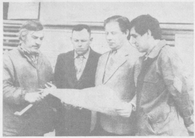
Они позволили значительно поднять производительность труда на ряде операций, сократить время обработки деталей. Сейчас на производстве успешно действует полуавтоматический участок дуговой сварки. Это дело рук людей пытливого ума. Изменена конструкция фрезы для обработки пневмодарных коронок — еще одно новшество рационализатора. Это дело весомую экономию твердосплавного металла. На заводе сформировались небольшие творческие коллективы, которые эффективно работают совместно уже не один год.

На первый взгляд, речь идет о незначительном новшестве — снижена металлоемкость в сотнях граммах. Однако это дает экономический эффект в сумме 7 тысяч рублей в год. До 14 тысяч корпусов в год выпускается за год на предприятии. А это значит, внедрение ценного предложения позволит сэкономить заводу более одиннадцати тонн металла.