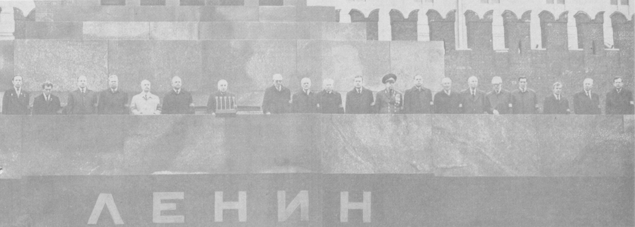
На снимке: траурный митинг на Красной площади. На трибуне Мавзолея В. И. Ленина.