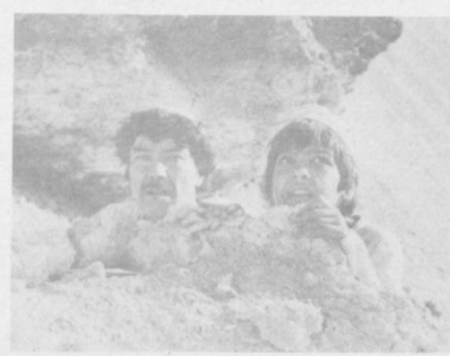
НА СНИМКАХ: кадры из фильмов «Юность гения» и «Переворот по инструкции 107».