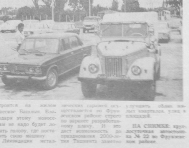
НА СНИМКЕ: открытая автостоянка № 22 во Фрунзенском районе.

Будут убраны и металлические гаражи около детского парка имени Ленина. На их месте по согласованию с владельцами машин решено построить открытую автостоянку. Также же место для хранения автомобилей