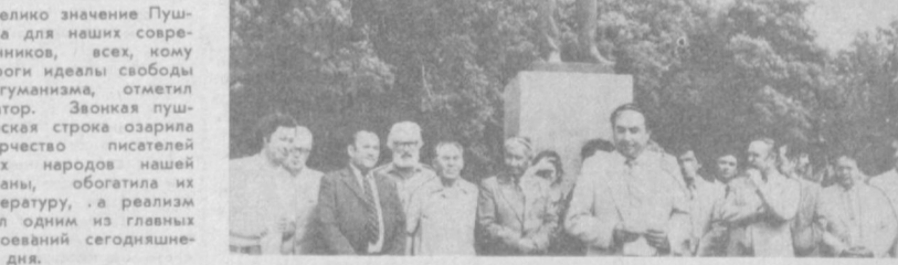
По традиции пушкинские чтения открылись у памятника великому поэту.

Велико значение Пушкина для наших современников, всех, кому дороги идеалы свободы и гуманизма, отметил оратор. Звонкая пушкинская строка озаряла творчество писателей всех народов нашей страны, обогатила их литературу, а реализм стал одним из главных завоеваний сегодняшнего дня.