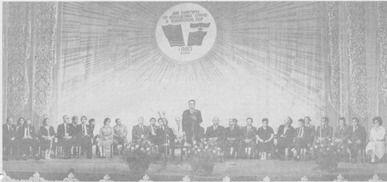
Ташкент. 6 июня 1983 года. ГАБТ имени А. Навои. Торжественное открытие Дней культуры Македонии (СФРЮ) в Узбекистане.

ОРГАН ТАШКЕНТСКОГО ГОРКОМА КП УЗБЕКИСТАНА И ТАШГОРСОВЕТА