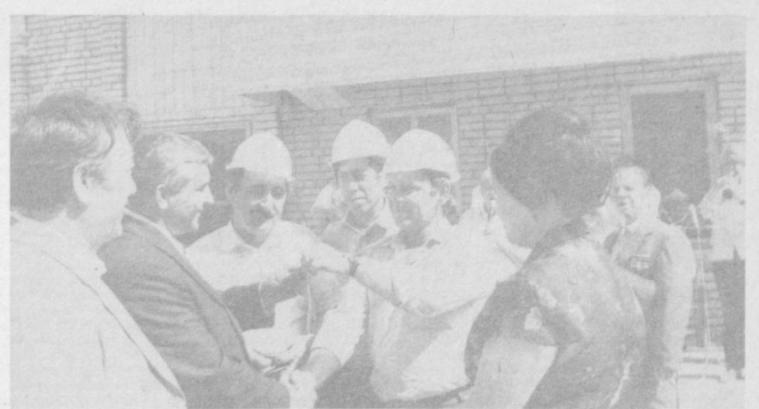
• По законам братства

☆ Вопросы совершенствования практики прокурорского надзора был посвящен проходящий в течение двух дней в Ташкенте региональный семинар-совещание.