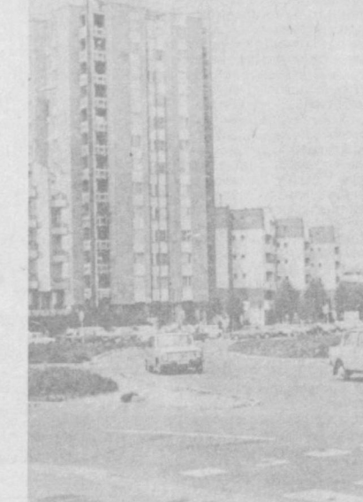
столица Македонской Социалистической Республики — зона отдыха.