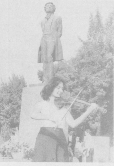
Продолжаются Пушкинские дни в Ташкенте. НА СНИМКЕ: у памятника А. С. Пушкину.