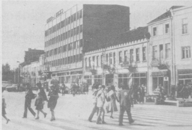
БОЛГАРИЯ. Сейчас Михайловград, названный в честь одного из мужественных руководителей восстания Христо Михайлова, — крупный промышленный и культурный центр Михайловградского округа. НА СНИМКЕ: в центре города.