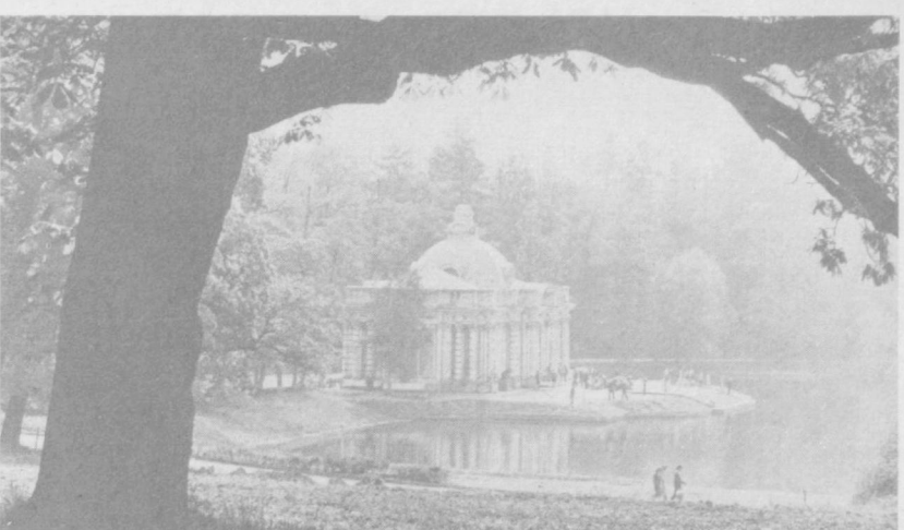
Летний сезон открыт в пригородных парках Ленинграда. В выходные дни сотни тысяч людей устремляются на лоно природы. Одно из самых любимых мест отдыха — город Пушкин, неразрывно связанный с творческой биографией великого русского поэта. В Пушкине — жемчужине русской национальной культуры — гостей ждут великолепные дворцы и красивые парки, привлекающие внимание как блестящие образцы паростроительного искусства. НА СНИМКЕ: павильон «Грот» в Екатерининском парке.

И славы блеск, и мрак изгнания, И светлых мыслей красота, И мщенье, бурная мечта Ожесточенного страдания.