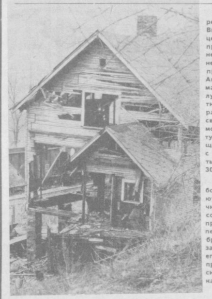
Тяжелые времена переживает штат Вирджиния — один из центров угледобывающей промышленности Соединенных Штатов. В этом промышленном районе Аппалачских гор гаснут мартены и домы металлургических предприятий, закрываются или работают в половную своих производственных мощностей шахты, растут безработица и нищета. За последние два с небольшим года работы лишились не менее 30.000 горняков. НА СНИМКАХ: безработные штата заполняют специальные карточки для получения пособия. Многие из них приходят сюда один из заброшенных домов. Из-за отсутствия работы их жильцам, вероятно, пришлось покинуть наименее места в поисках лучшего.

Прототипом для отечественных автобусов различных марок, уже перевезших десятки миллионов пассажиров, служат модели знаменитых «Икарусов». Машины, которые в ближайшее время начнут сходить с двух сборочных конвейеров, будут обходиться значительно дешевле, чем закупка готовых автобусов подобного типа за рубежом.