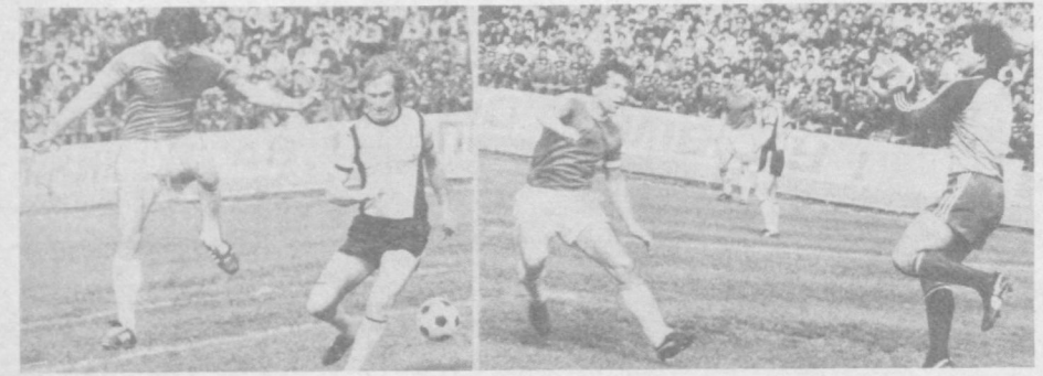
НА СНИМКАХ: в игре «Пахтакор».