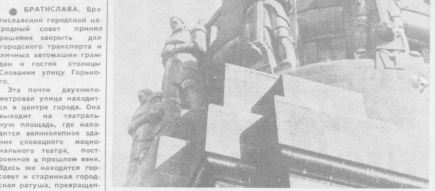
БРАТИСЛАВА. Братиславский городской народный совет принял решение закрыть для городского транспорта и личных автомашин граждан и гостей столицы Словакии улицу Горького.

Эта почти двухкилометровая улица находится в центре города. Она выходит на театральную площадь, где находится великолепное здание словацкого национального театра, построенное в прошлом веке. Здесь же находится городской совет и старинная городская ратуша, превращенная в музей.