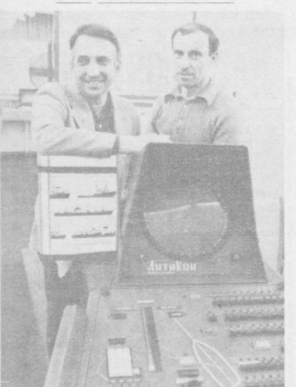
Высокой эффективности научно-исследовательских работ достиг коллектив Института кибернетики имени В. М. Глушкова Академии наук Украинской ССР.

130 миллионов рублей — таков экономический эффект, полученный в одиннадцатой пятилетке от внедрения его рекомендаций. На каждый затраченный рубль институт сегодня возвращает государству 7,8 рубль.