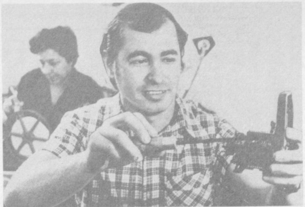
Республиканский центральный телеграф. Немало работников телеграфа носят почетное звание ударника коммунистического труда. Один из них — электромонтер член КПСС В.

канских организаций. Тема конференции — «Совершенствование хозяйственного механизма в свете решений XXVI съезда партии и ноябрьского (1982 г.) Пленума ЦК КПСС».