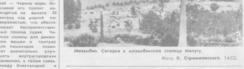
МОЗАМБИК. Сегодня в мозамбикской столице Малулу.

Как сообщили корреспонденту ТАСС в Братиславском городском народном совете, ныне практически все исторический центр Братиславы, так называемый старый город, превращен в тихую зону, куда строго-настроено запрещен въезд наного-либо вида транспорта.