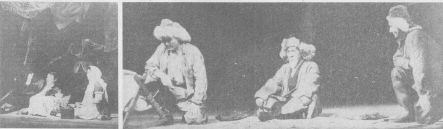
С большим успехом в Ташкенте проходят гастроли Казахского академического театра драмы имени М. Ауэзова. НА СНИМКАХ: сцены из спектакля лауреата Государственной премии СССР А. Нурликисова «Кровь и пот».