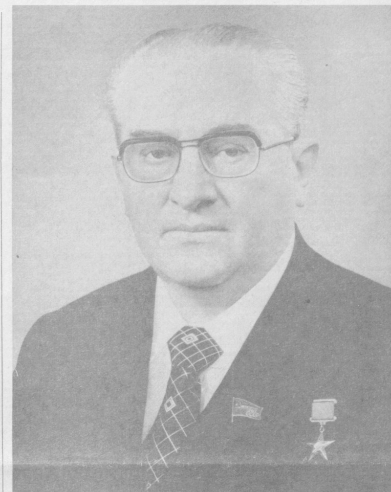
Генеральный секретарь ЦК КПСС, Председатель Президиума Верховного Совета СССР товарищ Юрий Владимирович Андропов