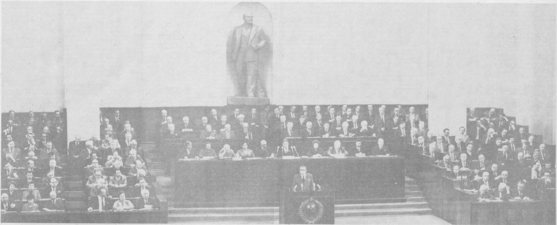
Восьмая сессия Верховного Совета СССР десятого созыва. Совместное заседание Совета Союза и Совета Национальностей.

Вчера в Москве завершила работу восьмая сессия Верховного Совета СССР десятого созыва. Депутаты единогласно приняли Закон СССР о трудовых коллективах и повышении их роли в управлении предприятиями, учреждениями, организациями.