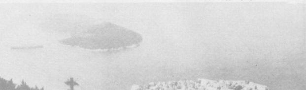
СФРЮ. Дубровник по праву называют жемчужиной югославской Адриатики. Этот городок на скалистом полуострове, обнесенный толстыми стенами с грозными бойницами, сохранил свой средневековый облик.