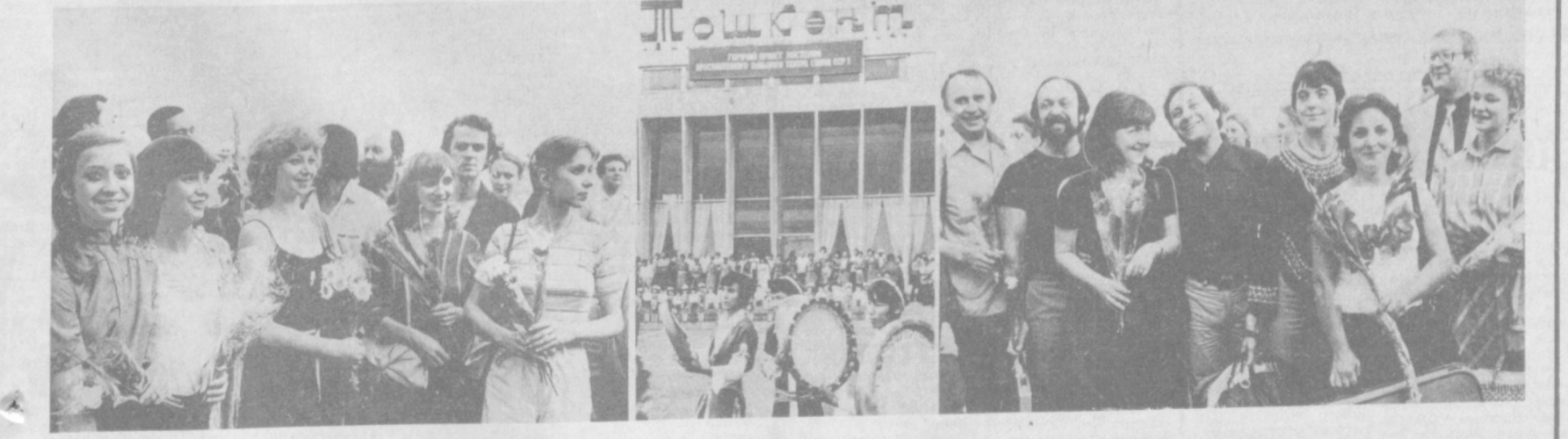
НА СНИМКАХ: встреча артистов дваждыордена Ленина Государственного академического Большого театра Союза ССР в Ташкентском аэропорту.