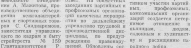
нают у рабочих чувство ответственности, способствуют успешному выполнению государственного плана.