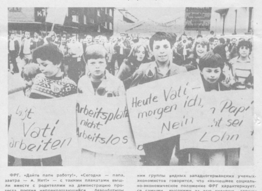
ФРГ. «Дайте папе работу!», «Сегодня — папа, завтра — я. Нет!» — с такими лозунгами вышли вместе с родителями на демонстрацию против неперспективной безработицы дети рабочих и служащих в рурском городе Хаттингене. Только по официальным данным, свыше двух миллионов незанятых зарегистрированы на биржах труда. В недавнем исследова-