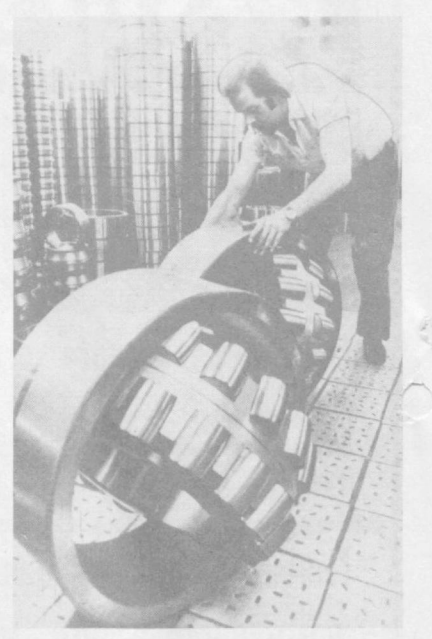
ГДР. На производстве подшипников качения для стран-членов СЭВ специализируется в рамках социалистической экономической интеграции завод в Лейпциге. Вот такие сферические роликоподшипники, какие вы видите на снимке, предназначены для использования в протатных цехах. Этой продукции присвоен государственный Знак качества. В ассортименте изделий лейпцигского предприятия — подшипники диаметром от 200 до 1.000 миллиметров. Они используются в тяжелом машиностроении, электромашиностроительной и судостроительной отраслях промышленности.

ДРЕВНЕЕ ПОСЕЛЕНИЕ открыто индийскими археологами на берегу реки Чамбал близ города Барнагар (штат Мадья-Прадеш). Ученые установили, что «возраст» поселения составляет 3.500—3.800 лет. В ходе раскопок найдены разнообразные орудия труда и предметы быта. В кладовых обнаружены зерна риса и пшеницы. Собранные данные дают основания предполагать, что поселение было разрушено в результате сильных наводнений и навсегда покинуто жителями в период X—VI вв. до н. э.