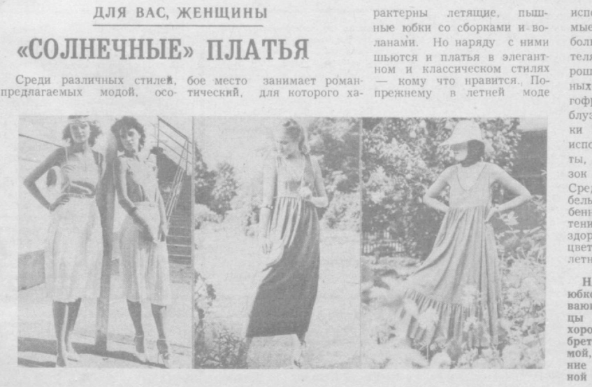
НА СНИМКАХ: с белой юбкой в складку, застегивающейся сбоку на пуговицы и гофрированной, очень хорошо выглядят блузки на бретельках с отделкой тесьмой, кружевом; простые летние платья с чуть завышенной талией.

Среди различных стилей, бое место занимает роман-предлагаемых модой, ослепительный, для которого характерны летящие, пышные юбки со сборками и воланами. Но наряду с ними шьются и платья в элегантном и классическом стилях — кому что нравится. По-прежнему в летней моде используются так называемые «солнечные» платья с большими декольте, на бретельках. Они, особенно хороши для молодых и стройных. С юбками в складку, гофре носят женственные блузки, облегающие кофточки на бретельках, в которых используются цветные канты, окрашенные в цвет блузок или платьев кружева. Среди модных цветов — белый и пастельные. Особенно хорошо помогает оттенить загар и подчеркнуть здоровый цвет лица белый цвет, изданная считающийся летним цветом.