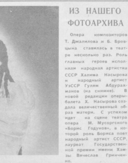
ИЗ НАШЕГО ФОТОАРХИВА