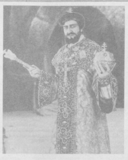
ИЗ НАШЕГО ФОТОАРХИВА