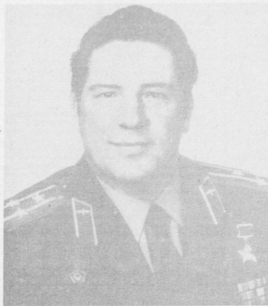
КОМАНДИР КОРАБЛЯ «СОЮЗ Т-9» ГЕРОЙ СОВЕТСКОГО СОЮЗА ЛЕТИЧКА-КОСМОНАВТ СССР ПОЛКОВНИК ЛЯХОВ ВЛАДИМИР АФАНАСЬЕВИЧ

Самочувствие космонавтов Ляхова и Александра Павловича хорошее.