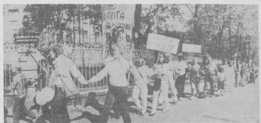
Кульминацией антивоенных мероприятий, состоявшихся в последнее время в Финляндии под девизом «Всена мира и надежд», стала массовая демонстрация в Хельсинки. Ее участники собрались у дворца «Финляндия», где был подписан исторический Заключительный акт общеевропейского совещания и, взявшись за руки, двинулись по улицам города к посольствам государств, подписавших Заключительный акт. По пути следования и ним присоединились другие демонстранты, и весь город был описан живой цепью людей, выражающих стремление сохранить процесс разрядки, положить конец гонимому вооружению, разряженной США и НАТО. НА СНИМКЕ: «цепочка мира».