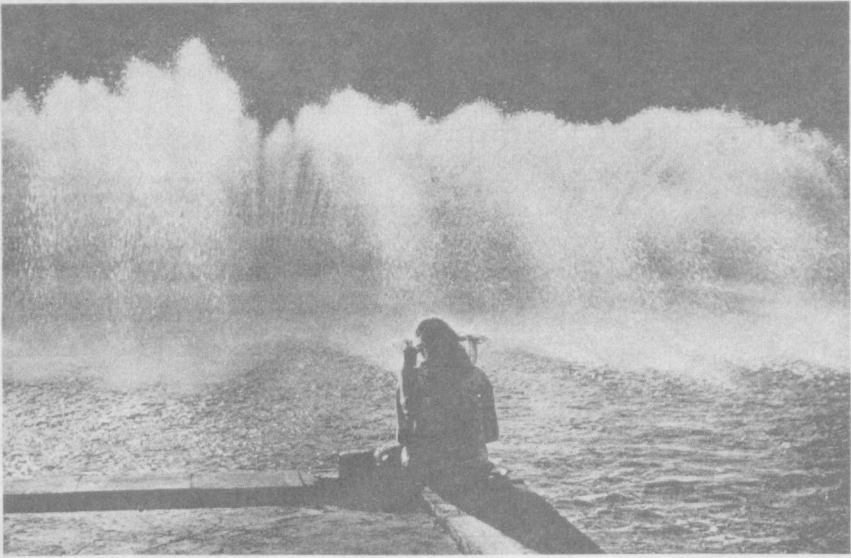
НА КОНКУРС «ТАШКЕНТСКАЯ ЛИРА». У фонтана.