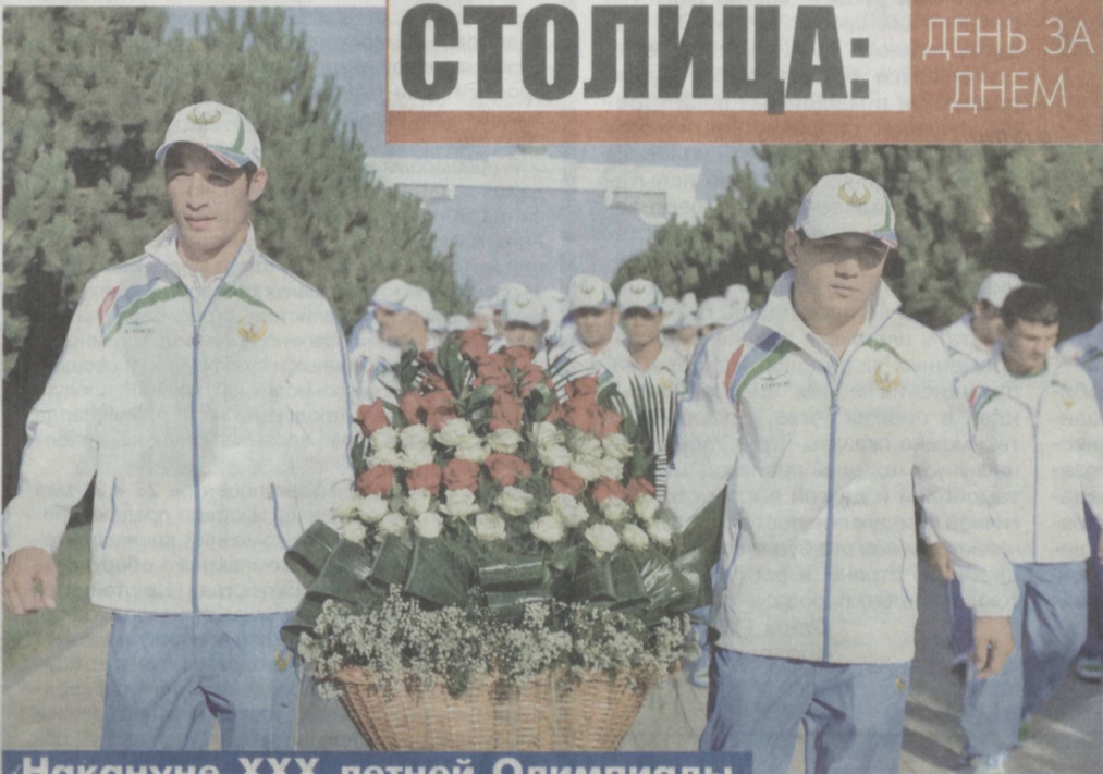
Накануне XXX летней Олимпиады