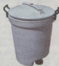
5-я специальная урна

– Использованные ртутные лампы будут размещаться в специальную посуду. Такая посуда не должна их повредить. Она не должна допускать выхода содержащейся в них ртути в воздух, попадания в источники водоснабжения, почву и продукты питания. Эта специальная посуда с отходами данного типа выбрасывается в установленные места.