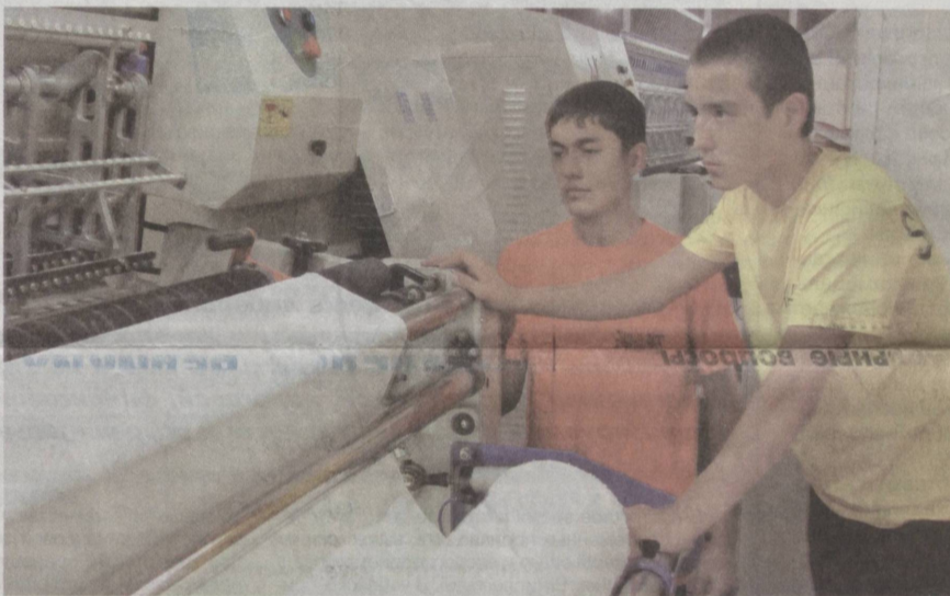
Продукция компании «SIMAKX-PARS» изготавливается с использованием самого современного оборудования.