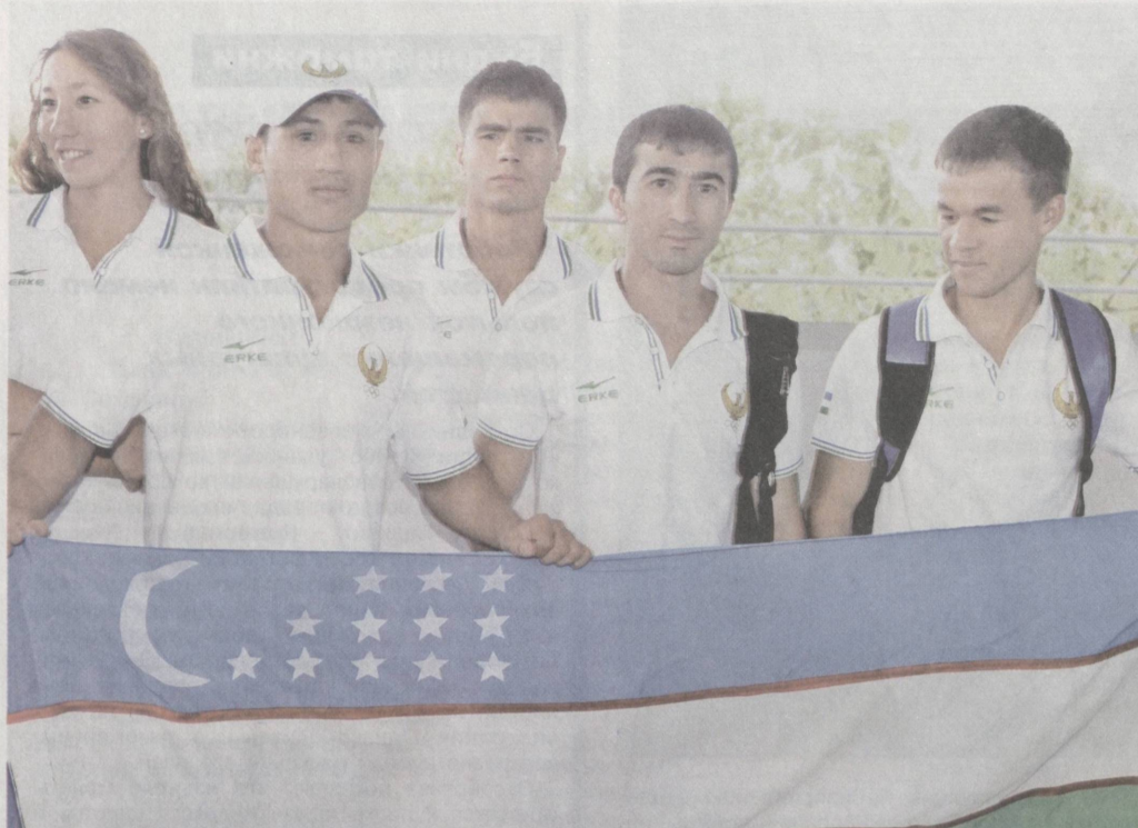
Спортивная делегация Узбекистана 24 июля отправилась в столицу Великобритании Лондон для участия в XXX летних Олимпийских играх.