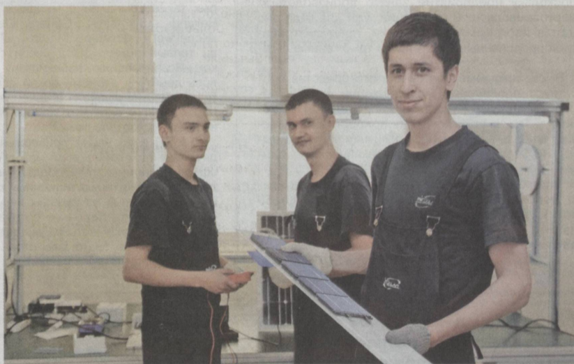
Будущие мастера на производственной практике.