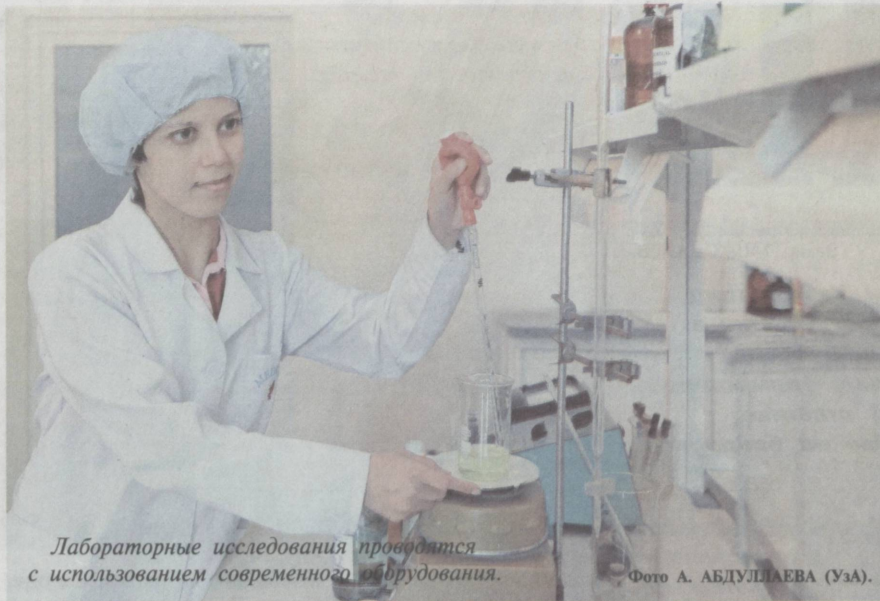
Лабораторные исследования проводятся с использованием современного оборудования.