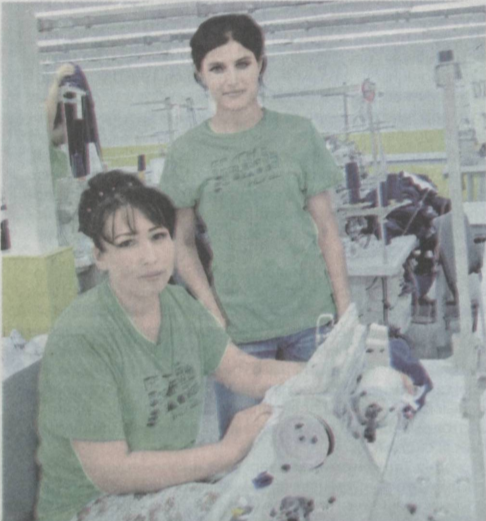
Двадцать первую годовщину независимости республики встречают достойными подарками и в Мирзо-Улугбекском районе.