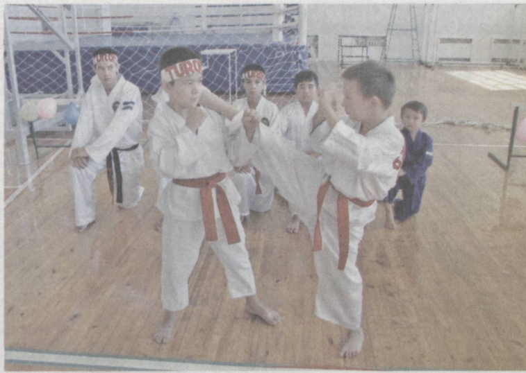
Путь к победам на соревнованиях начинается в детских спортивных секциях.