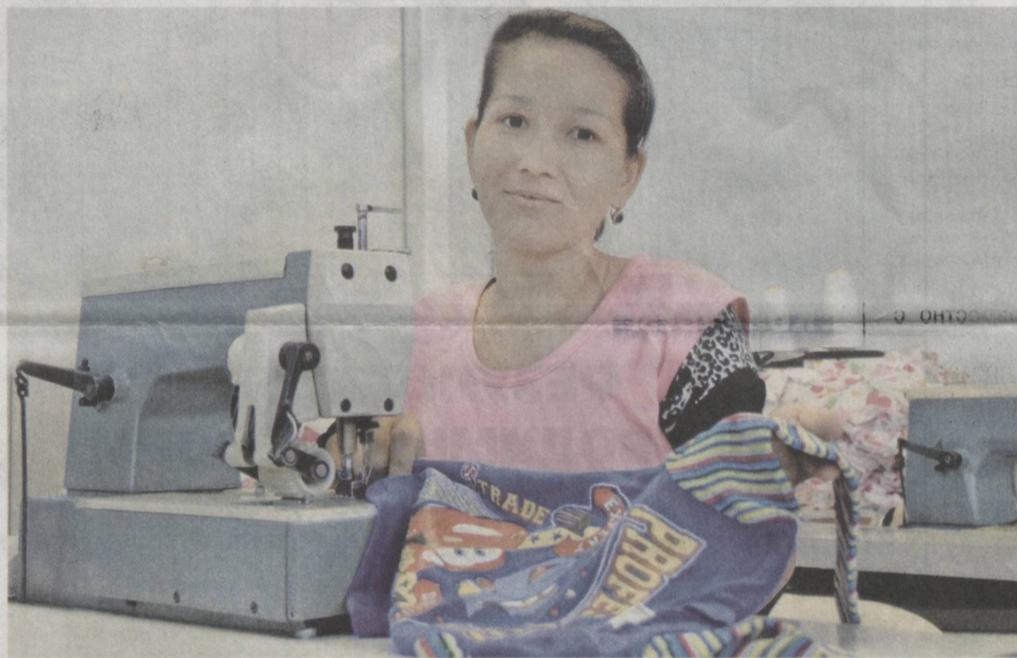
Выпуск швейных изделий – динамично развивающаяся сфера малого бизнеса.