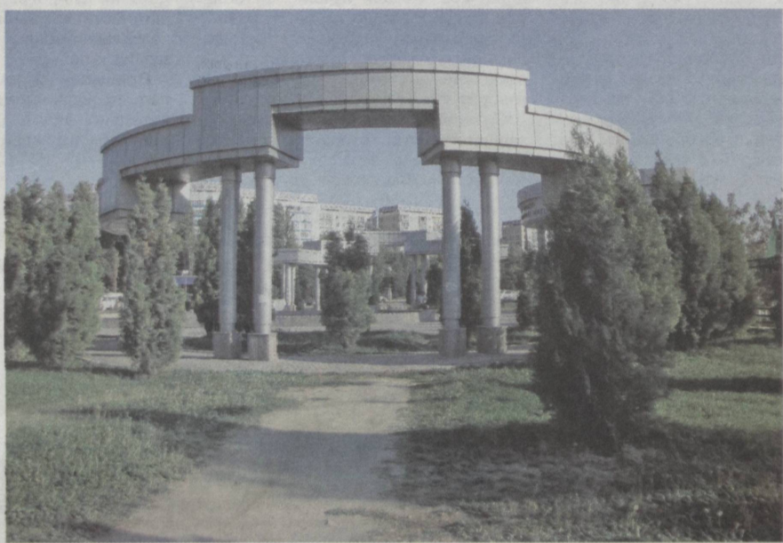
Зеленые насаждения – легкие города.