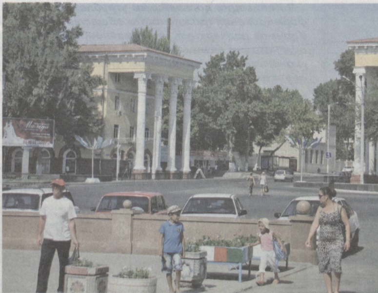
Праздничный облик столицы.