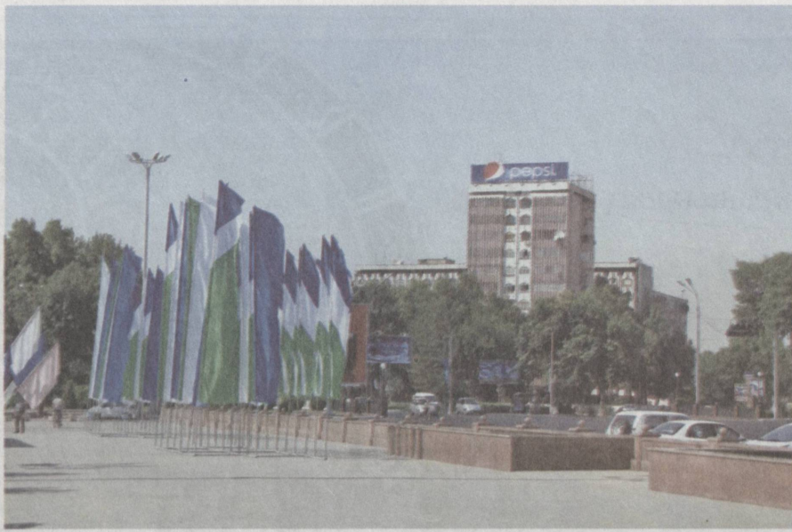
Улицы столицы в предпраздничном убранстве.

В стране уделяется особое внимание развитию детского спорта, оснащению спортивных комплексов необходимым инвентарем, обеспечению их квалифицированными тренерами, широкому привлечению мальчиков и девочек к занятиям спортом.