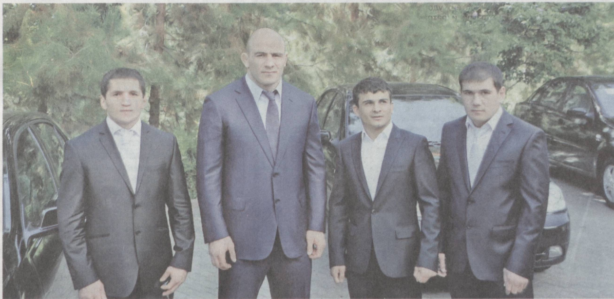
В Музее Олимпийской славы 29 августа состоялась церемония награждения победителей и призеров XXX летних Олимпийских игр.