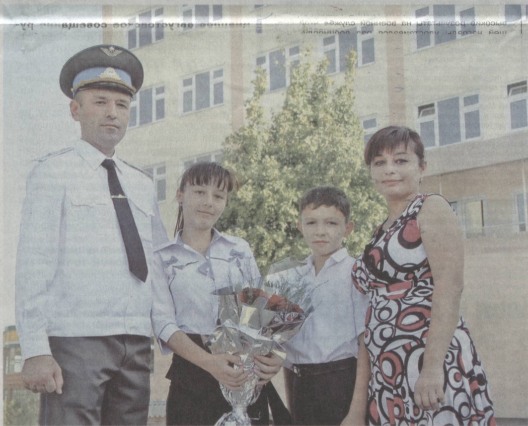
Защита Родины – священный долг