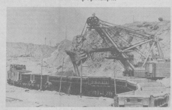
ОРЕНБУРГСКАЯ ОБЛАСТЬ. Коллектив Кнембаевского асбестового горно-обогатительного комбината с начала года выпустил более 3,5 тысячи тонн продукции сверх плана. В социалистическом соревновании предприятий отрасли комбинат занимает первое место и удерживает переходящее Красное знамя.