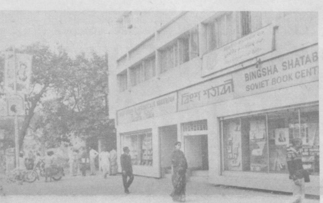
Неузнаваемо меняется облик Калькутты — одного из крупнейших культурных и промышленных центров Индии. Расширяются мосты и магистрали, ведется закладка новых парков. Одна из самых известных строен города — Калькутское метро. Его строительство осуществляется при техническом и экономическом содействии Советского Союза.