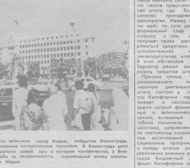
НА СНИМКЕ: на улицах Бомбей.