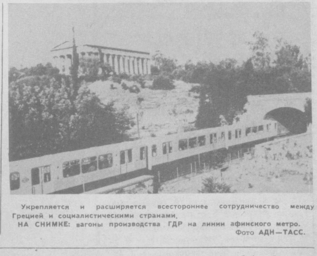
Укрепляется и расширяется всестороннее сотрудничество между Грецией и социалистическими странами. НА СНИМКЕ: вагоны производства ГДР на линии афинского метро.

ДЕЛИ. Индия — единое государство. Любые попытки подрывать ее территориальную целостность будут пресечены твердой рукой, заявил президент Индии Зайл Сингх. Выступая на митинге в г. Карнале (штат Харана), он подчеркнул, что те силы, которые разжигают в стране религиозно-общинную рознь и добиваются раздела Индии, идут по стопам британских колонизаторов. Зайл Сингх призвал к упрочению национального суверенитета Индии.