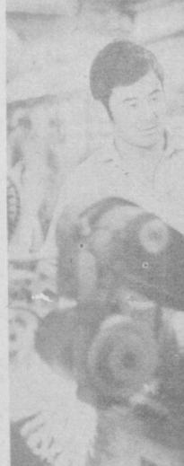
100 тонн горячекатаного профилированного металла получило производство за истекший год от рационализаторской деятельности людей завода «Подъемник».

На территории нашего района, занимающего 3.610 гектаров, проживают более 200 тысяч человек. В их числе 115 многодетных семей, и почти все они обеспечены современными удобствами квартир. Да это и не удивительно: ведь только за прошедшее полугодие были введены в строй 61.859 квадратных метров жилой площади, а до конца года еще 3 тысячи семей смогут въехать в благоустроенные дома. Хороший подарок недавно получили и наши дети. Для них построена пре-