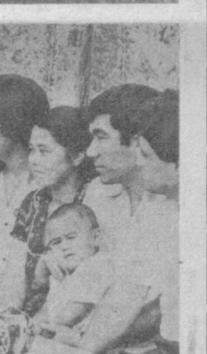
Член молодежной организации Октябрьского района.

В течение следующей недели мы познакомим читателей с жизнью Октябрьского района.