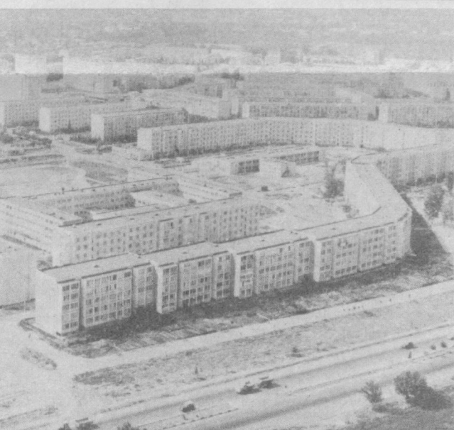
Массив Юнусабд сегодня.

Парковая зона Анхора, улица Б. Хмельницкого, восстановительный ремонт фасадов домов в микрорайонах Кировского, Хамзинского, Сабир-Рахимовского, Фрунзенского и других районов города — вот далеко не полный «адреса» добрых дел, которыми в эти дни заняты бригады ремонтно-строительного треста № 2 Ташгорисполкома. Задание у специалистов особое — выполнить благоустроительные работы в плане подготовки объектов социальности к 2000-летию Ташкента.