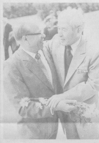
Советские люди отмечают 40-летие Победы советских войск над гитлеровскими полчищами в битве на Огненной дуге. В городе и области проходит встреча ветеранов войны.