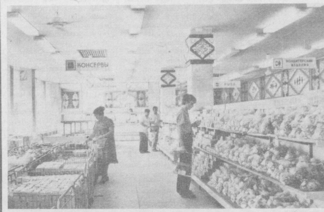
НА СНИМКАХ: новый универсам.

Особенно развито торговля. Только в нынешнем году распахнули двери 20 магазинов. Причем большая часть из них работает по методу самообслуживания.