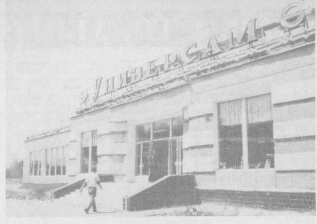
Завтра-День работников торговли