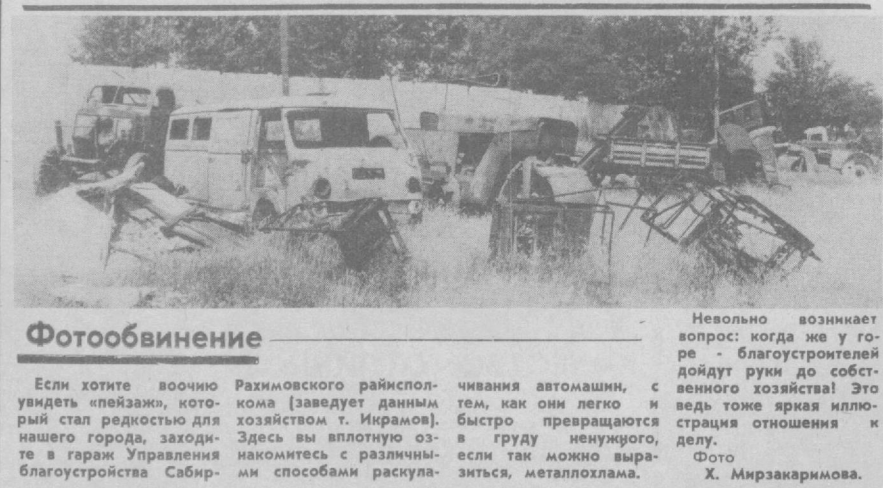
Невольно возникает вопрос: когда же у горе-благостроителей дойдут руки до собственного хозяйства! Это ведь тоже яркая иллюстрация отношения к делу.

Н. ИБРАГИМОВА, инспектор городского комитета народного контроля.