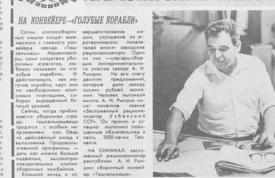
НА КОНВЕЙЕРЕ — ГОЛУБЫЕ КОРАБЛИ