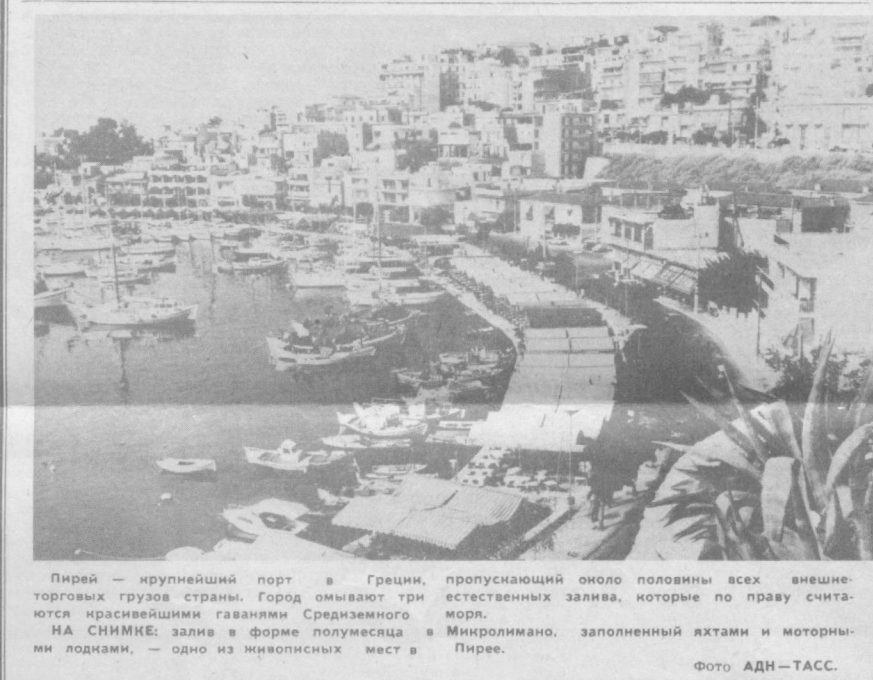
Пирей — крупнейший порт в Греции, торгующий грузом страны. Город омывают три моря. НА СНИМКЕ: залив в форме полумесяца в Микролимано, заполненный яхтами и моторными лодками. — одно из живописных мест в Пирее.

СОФИЯ. «Цветущий край» — так называют Болгарию туристы. Этому признают Болгария обязана цветам, которые украшают парки и скверы, улицы и площади городов и сел. Дворы домов. Благоприятный климат и богатые традиции способствовали созданию в НРБ целой индустрии цветов. Их выращиванием занимаются государственные объединения «Булгарплод» и многие АПК страны. В торговую сеть и организациям по благоустройству городов и сел поступает более 100 видов декоративных растений. Среди них 20 разновидностей гвоздики, 40 — роз, 6 — хризантем, десятки других видов цветов. Болгарские селекционеры за последние годы вывели новые сорта. Так, недавно был получен новый сорт гвоздики, который величиной цветка и ароматом превосходит популярный в целом мире сорт «сим». Выведены и оригинальные цветы — виошский тюльпан, песчаная лилия.