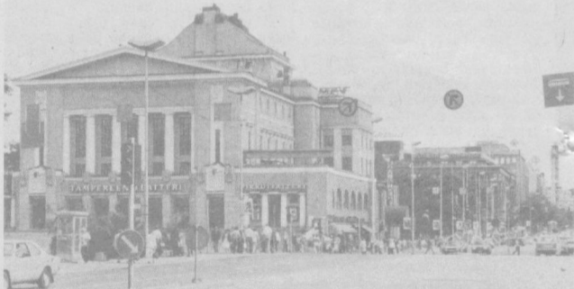
К настоящему времени 50 финских и столько же советских городов поддерживают и развивают многогранные отношения дружбы и сотрудничества. Москву и Хельсинки, Иев и Тампере, Таллин и Нотку, Мурманск и Рованими связывают тесные контакты. Порожденные города регулярно обмениваются делегациями, проводят совместные выставки и семинары. НА СНИМКЕ: здание городского театра в Тампере.