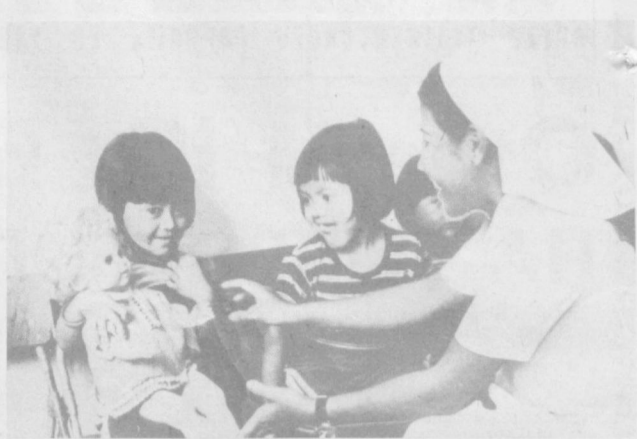
НРК. Большую заботу о самых маленьких гражданах республики проявляет Народно-революционная партия Кампучии. В стране уже открыто более 600 дошкольных учреждений, которые посещают около 20 тысяч малышей. Государство обеспечивает ребят бесплатным питанием, под детские сады отведены лучшие помещения, открыты курсы по подготовке воспитателей. Большую помощь в этом деле Кампучии оказывают братские социалистические страны — из Советского Союза, Болгарии, ГДР поступают для детских садов мебель, игрушки, продукты питания — дар женских и общественных организаций. НА СНИМКЕ: в одном из детских садов Пномпеня.

● ВЕНА. 100-летию со дня сооружения венской ратуши — одного из замечательных архитектурных памятников австрийской столицы — посвящена юбилейная монета, которую выпустил Монетный двор Австрии. На одной стороне монеты достигнуто в 500 шиллингов изображено здание ратуши, на другой — гербы Австрии и девять федеральных земель.