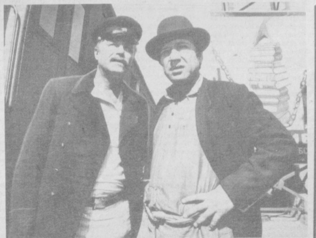
На студии «Узбекфильм» режиссеры Ю. Агазов и З. Ройзман приступили к съемкам новой ленты «Пароль: «Отель «Регина». Сценарий М. Мелкумова и А. Макарова рассказывает о чехистах первых лет революции, когда устанавливалась в Туркестане Советская власть.

Б. ОЛЕНИН. (АПН). Редактор Ш.О.УБАЙДУЛЛАЕВ. 3 Вечерний Ташкент. 27 августа 1983 г.