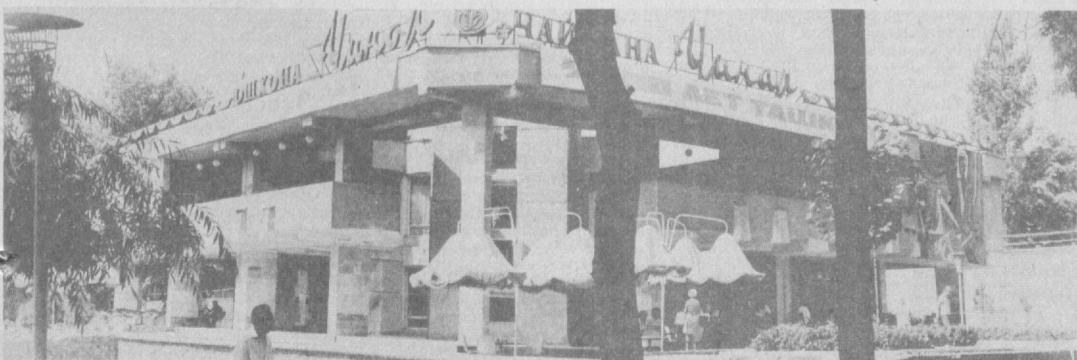
НА СНИМКЕ: чайхана «Чинар».

Узбекская кухня пользуется заслуженной славой далеко за пределами республики. Именно поэтому гости нашего города не обходят вниманием столовые, кафе и рестораны Ташкента.