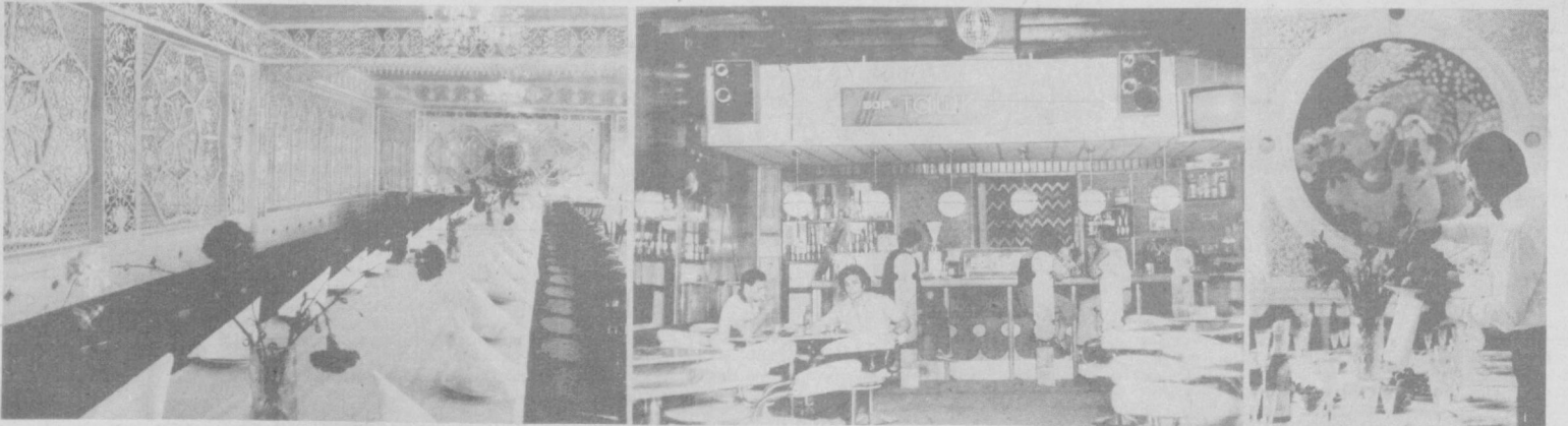
Накануне 2000-летия Ташкента вступили в строй десятки «Юлдуз», что находится по улочке Ш. Руставели. Теперь реконструкция старых и новых предприятий общественного питания. Горочанам и гостям из столицы Узбекистана они, несомненно, понравятся. Изменило свой облик кафе «Юлдуз», что находится по улочке Ш. Руставели. Теперь реконструкция старых и новых предприятий общественного питания. Горочанам и гостям из столицы Узбекистана они, несомненно, понравятся. Распахнуло свои двери и кафе «Ташкент» в парке имени Тельмана. С большим вкусом оформлен расположенный здесь же бар. Его посетители могут здесь послушать музыку, выпить коктейль. Особенно удачно выполнены интерьеры этих предприятий общественного питания. Кафе «Нилуфар» на массиве Черданчево стало намного уютнее после проведенной реконструкции. Много фантазии и творческой выдумки проявили работники Куйбышевско-