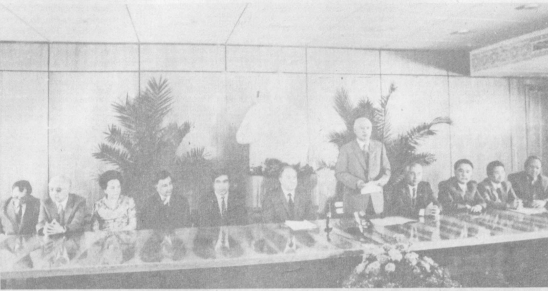
Ташкент. 1 сентября 1983 года. Встреча в Центральном Комитете Компартии Узбекистана с ветеранами партии.

той Министерства мелиорации и водного хозяйства Узбекской ССР, Министерства плодородного хозяйства республики и Государственного комитета Узбекской ССР по водохозяйственному строительству, по комплексному освоению и эффективному использованию земель в совхозах. Депутаты отметили, что Минводхозом и Минпло-