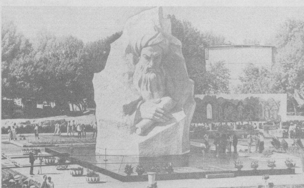
На снимке: монумент Аль-Хорезми, воздвигнутый в центре жилого массива Чиланзар.