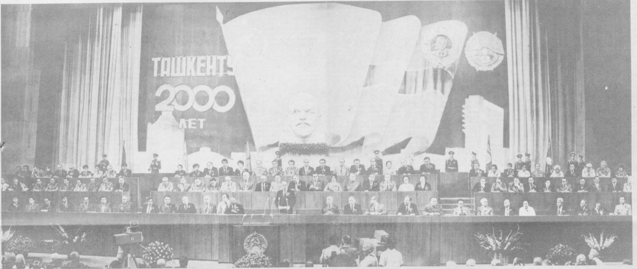
В президиуме торжественного собрания, посвященного 2000-летию Ташкента и вручению городу ордена Ленина.