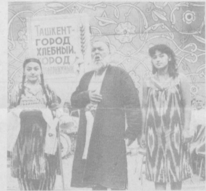
З. Тельмана; свою хлебную продукцию демонстрируют кондитеры — булочники столовой № 8 Кировского райтреста столовых.