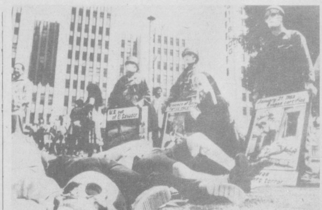
США. Прекратить вмешательство во внутренние дела стран Центральной Америки, остановить гонку вооружений потребовали участники этой демонстрации, состоявшейся в Лос-Анджелесе.

товленных из них консервов. К тому же при этом снижаются затраты на транспорт, погрузочно-разгрузочные работы. Одно из главных условий бесперебойной работы конвейера — постоянно расширяющиеся связи перерабатывающих предприятий с сельскохозяйственными кооперативами и госхозами. Сейчас более 60 процентов овощей и фруктов поступает на переработку из 260 так называемых базовых хозяйств. Совместно с перерабатывающими предприятиями они определяют, какие сельскохозяйственные культуры необходимо выращивать и в какие сроки