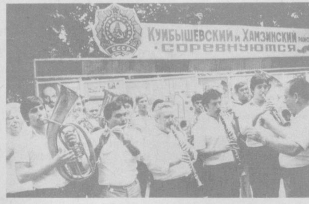
КУБЫШЕВСКИЙ И ХАНЗИНСКИЙ МАШИНСКО-СТРОИТЕЛЬНЫЕ ЗАВОДЫ СОРЕВНОВАЮТСЯ