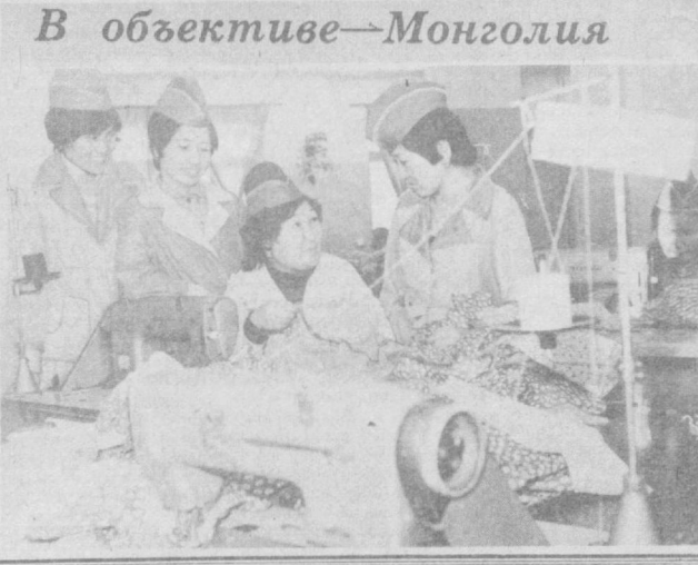
В объективе — Монголия