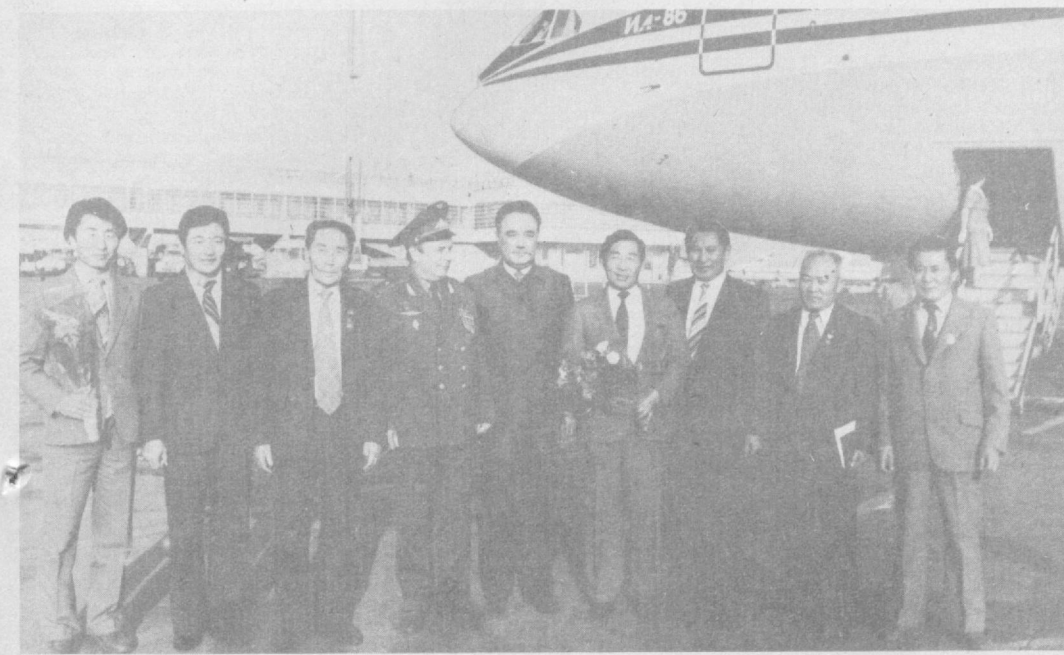
Во время встречи в аэропорту.