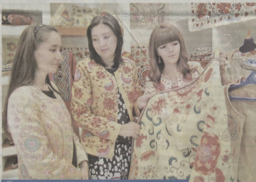
Возрождая народные ремесла