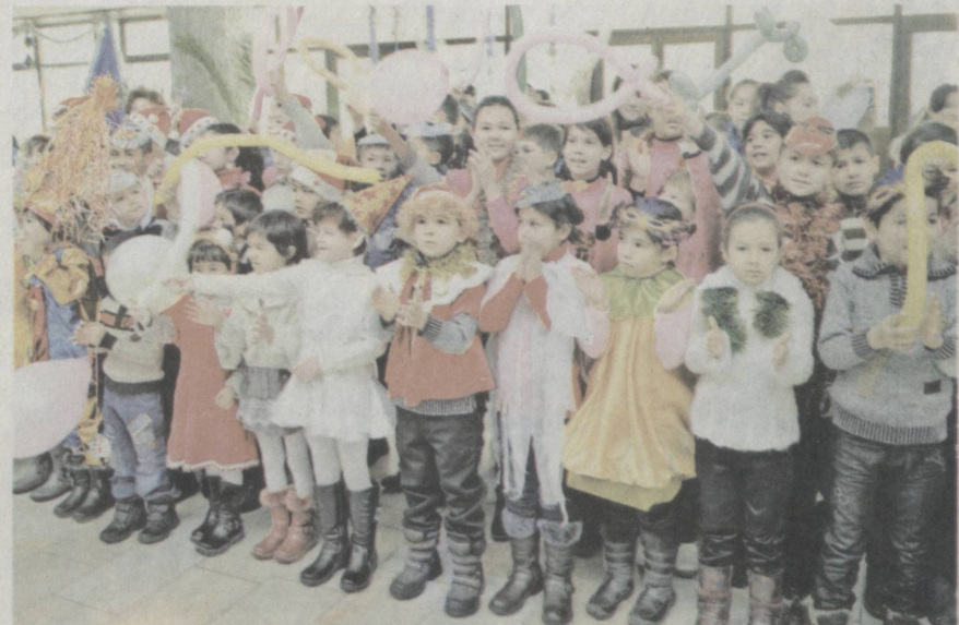
Ребята ждут веселые каникулы.

Ярмарки сельскохозяйственной продукции будут работать до 10 января. Сайёра ШОЕВА, корр.УзА.