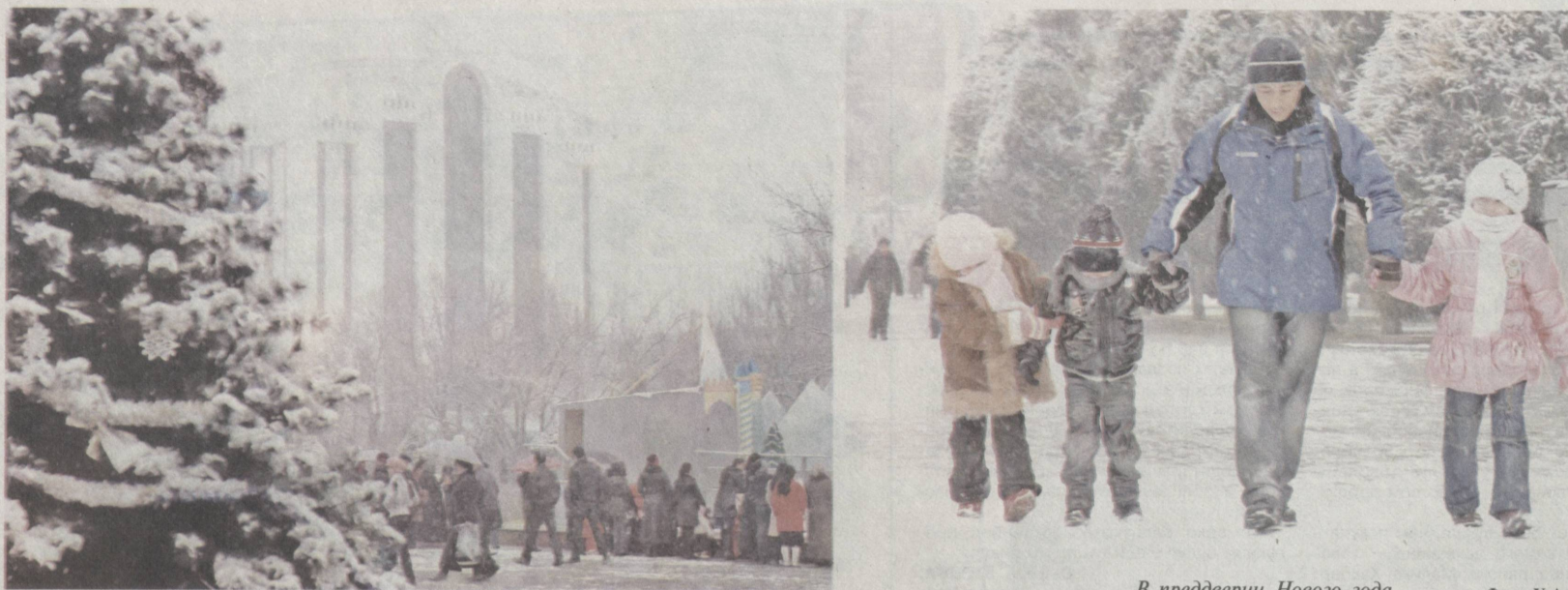
В преддверии Нового года.