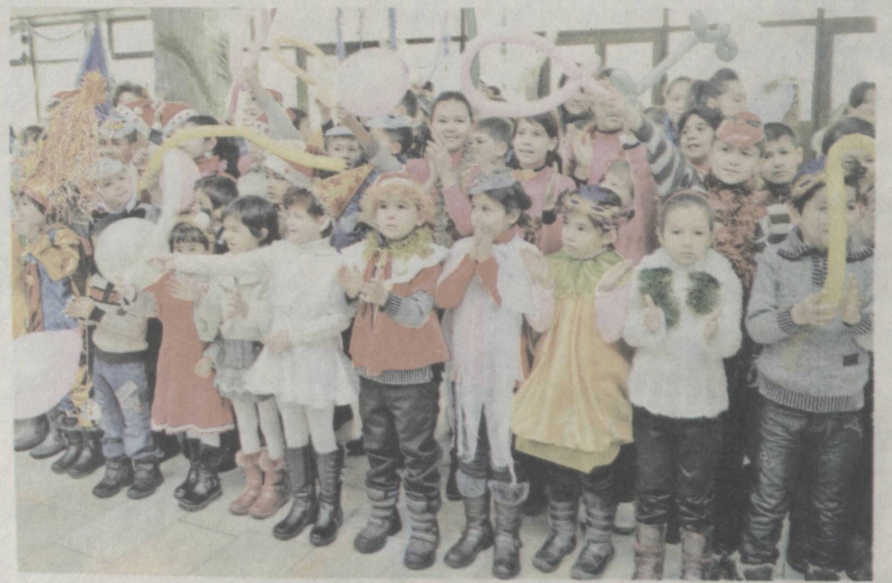
Ребята ждут веселые каникулы.

O'ZBEKISTON SAVDO-SANOAT PALATASI TOSHKENT SHAHAR HUDUDIY BOSHQARMASI