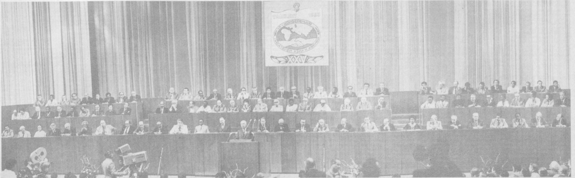
Ташкент, 26 сентября 1983 года. НА СНИМКЕ: торжественное открытие VII конференции Ассоциации писателей стран Азии и Африки.

Желаю вам больших успехов в общественном и литературно-творческой деятельности, личного счастья. Ю. АНДРОПОВ