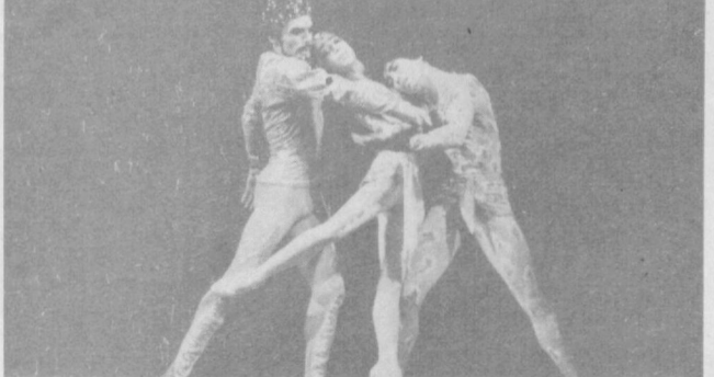
НА СНИМКАХ: сцены из балета «Поэма двух сердец» и оперы «Фауст», с которыми выступит ГАБТ имени А. Навои в Москве.

Мы прекрасно понимаем, что москвичи видели выступления многих знаменитых коллективов.