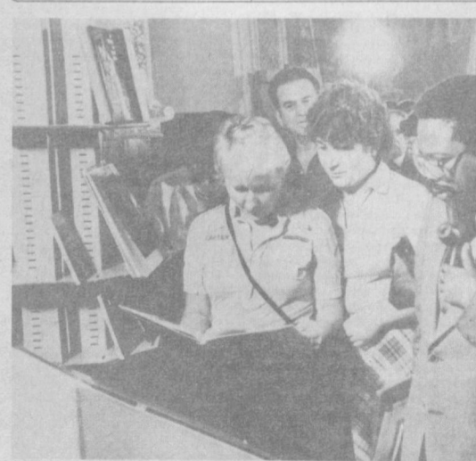
Участники и гости VII Конференции писателей Азии и Африки продолжают знакомиться с достопримечательностями столицы.

نجاحت باهتة بكتابها Asia and Africa! Au succes du travail des ecrivains d'Asie et d'Afrique!