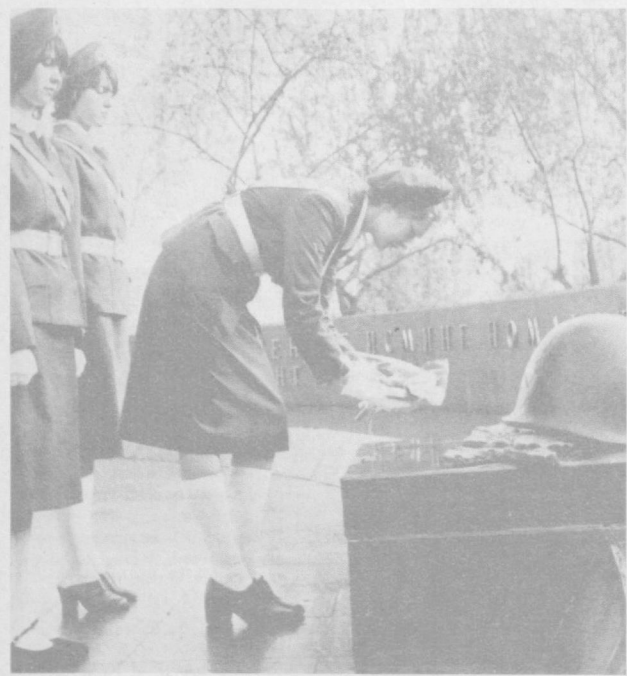
Никто не забыт, ничто не забыто

надо усилить идеологическую, политико-воспитательную работу в коллективе, как того требуют решения июньского (1983 г.) пленума ЦК КПСС. Без этого трудно будет добиться успехов в дальнейшем. И можно было быть уверенным, что парторганизация с этой задачей справится. Поручкой тому — боевой настрой коммунистов. Предложения коммунистов нашли отражение в решении, принятом на отчетно-выборном собрании. И. МАРГОННИ.