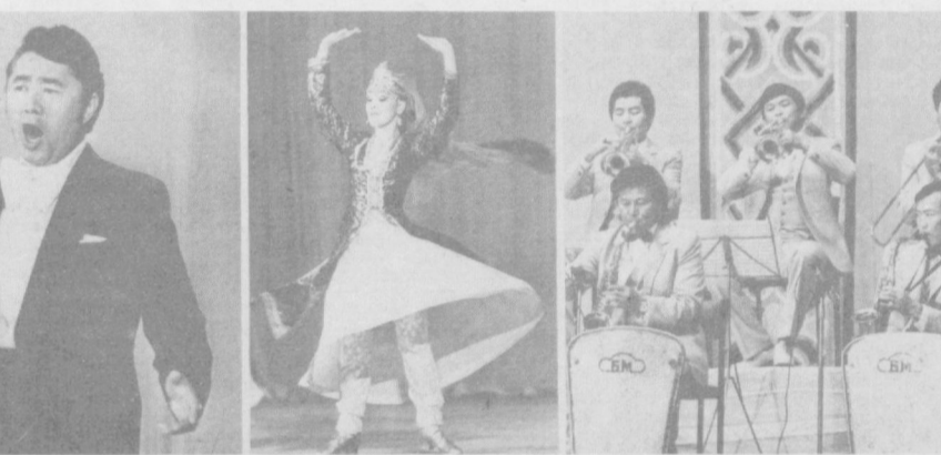
В Узбекистане успешно проходят Дни Монгольской Народной Республики. НА СНИМКАХ: выступают мастера искусства Монголии.

Всесоюзная фирма «Мелодия» выпустила диск с нашими песнями — это для нас большая честь. Сам я окончил Ленинградскую консерваторию по отделению дирижирования и аранжирования. Выступал и в качестве композитора. Творческое сотрудничество с вашим замечательным ансамблем «Ялла» помогло нам разучить несколько песен об Узбекистане. Мы счи-