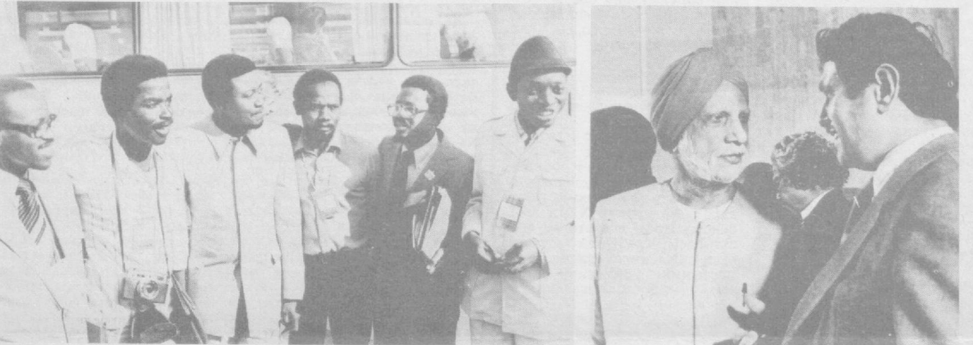
Группа африканских писателей — участников ташкентской конференции; в перерыве между заседаниями конференции.