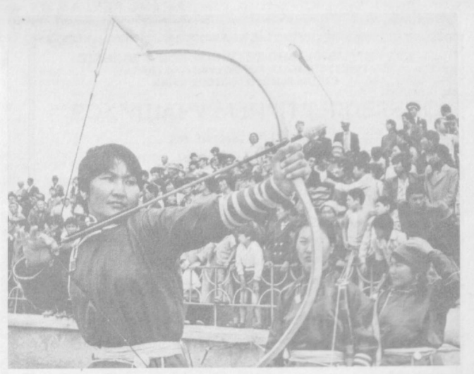
НА СНИМКАХ: в объективе Монголия — традиционное соревнование в стрельбе из лука; на отгонном пастбище.

И. ДРАВКИНА, научный сотрудник Института Востоковедения АН УзССР.