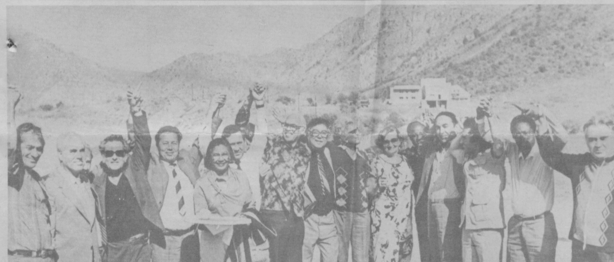
«Нас сдружил Ташкент!» — говорят участники международной Конференции писателей Азии и Африки.