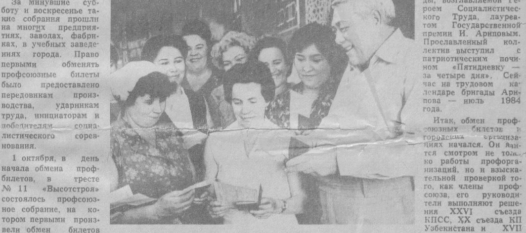
НА СНИМКЕ: вручение новых профсоюзных билетов в производственном швейном объединении имени 50-летия Узбекской ССР и Компартии Узбекистана.

Итак, обмен профсоюзных билетов в организации начался. Он начался смотра не только работы профсоюзной организации, но и всесторонней проверки того, как члены профсоюза, его руководители выполняют решение XXVII съезда КПСС, XX съезда КП Узбекистана и XVII съезда профсоюзов СССР.