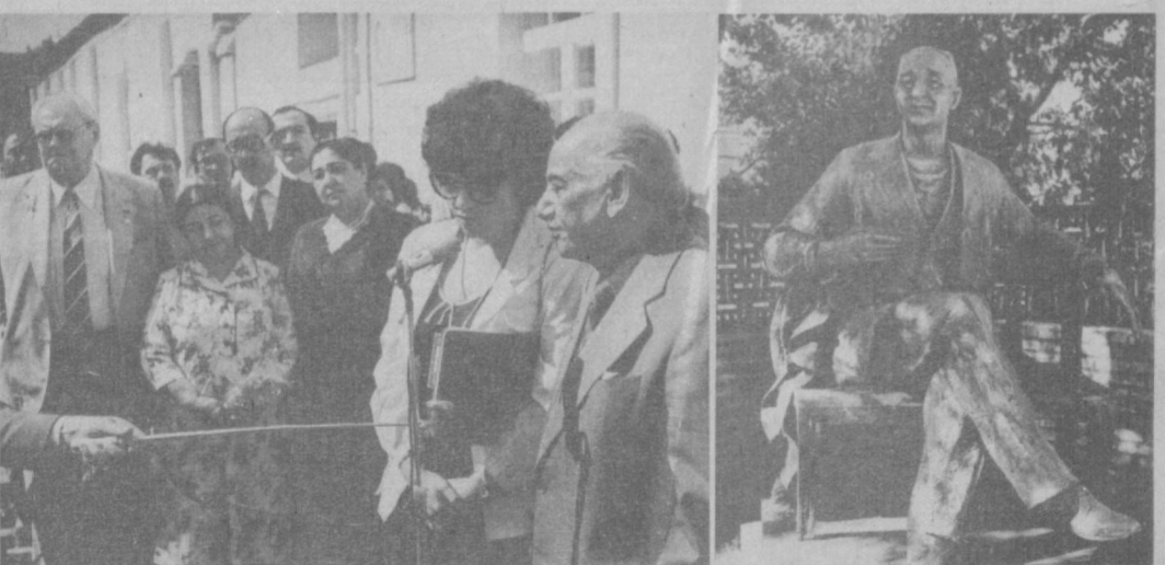
НА СНИМКАХ: открытие Дома-музея Гафура Гуляма; памятник Гафуру Гулямю.

Дом на улице Арпапая, что недалеко от площади Бешагач, знаменитый ташкентцам и жителям нашей республики. Здесь жил и творил известный узбекский советский писатель Левинский Гурьям Гафура Гуляма. 1 октября, в день завершения Конференции писателей Азии и Африки, на работу, которую осуществило производственное объединение «Мемор» Министерства культуры республики.